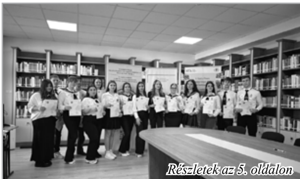
Részletek az 5. oldalon