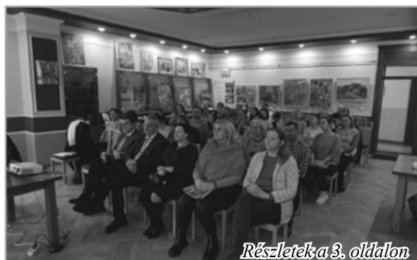
Részletek a 3. oldalon