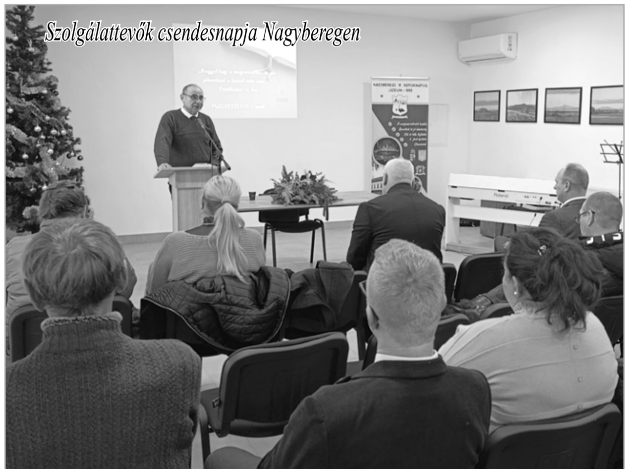
Szolgálattevők csendesnapja Nagyberegen

A Beregi Református Egyházmegye Misszió Bizottsága január 17-én mintegy 170 résztvevővel munkatársi csendesnapot szervezett Nagyberegen azzal a céllal, hogy erősítse a gyülekeze-tek szolgálattevőit, a lel-készeket, presbitereket, bibliaórávezetőket, hit-oktatókat, gyermekmun-kásokat, diakóniai szolgál-tatot végzőket, beteggon-dozókat, kántorokat, kó-rustagokat. A szervezők vallják: a szolgálattevők munkájára nagy szükség van a gyülekezetekben, hiszen egyre több a meg-fáradt ember, aki várja azt az „angyalt”, akit hoz-zá küld az Úr. Ez a feladat vár a munkatársakra. Ám, hogy el tudják végezni a rájuk bízott feladatot, nekik is erősödni kell. Szükséges, „hogy minden egyes tagja erejéhez mérten közösen munkálja a test növekedését, hogy épüljön a szeretetben” (Ef 4, 15). Folytatás a 3. oldalon