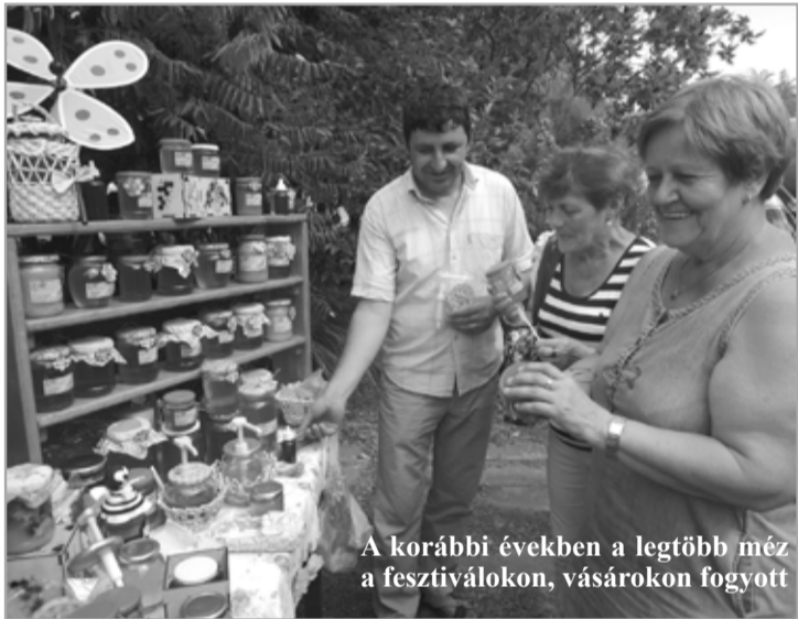
A korábbi években a legtöbb méz a fesztiválokon, vásárokon fogyott

– Hallani olyasmiről is, hogy a mezőgazdaságban felhasznált hatalmas vegyszermennyiség miatt a mostani méhgeneráció már nem olyan edzett, és a betegség-