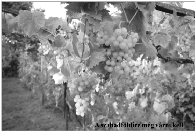
A szabadföldre még várni kell

megezőlő megtermelése sem. Bár a főlíaházi portékának a növényvédelme kevésbé összetett, a folyamatos hajtásválogatás, a fürtrendezés sok élömunkát igényel. No és nem