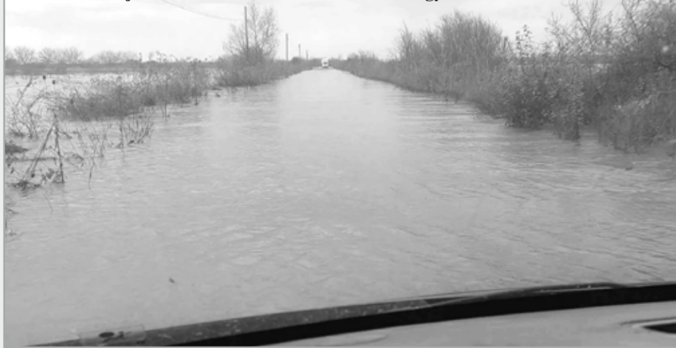
A víz szinte teljesen elöntötte a Feketeadórból Szőlősgyulára vezető utat

számolója szerint nyár közepén a Szernye-mocsárban mellmagassá-