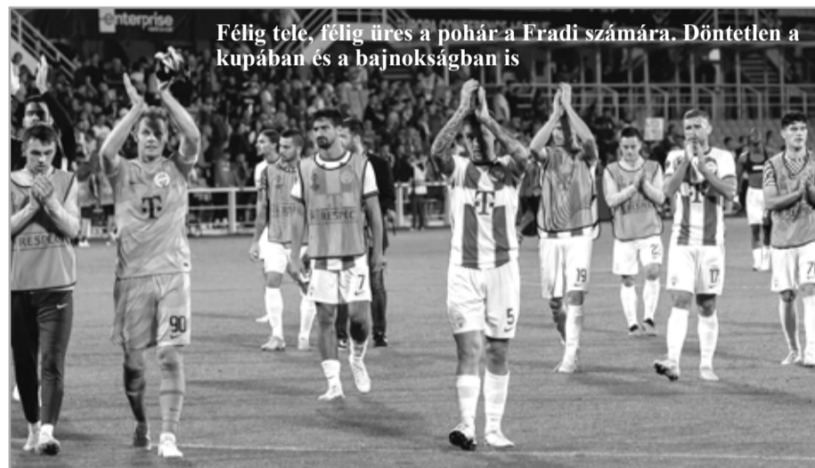
Félig tele, félig üres a pohár a Fradi számára. Döntetlen a kupában és a bajnokságban is

Eredmények: FTC – Debrecen 2-2, Puskás Akadémia – Kisvárdá 1-0, Mező-