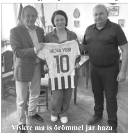
Viskre ma is örömmel jár haza

– Az utóbbi néhány évben önnek is nagy szerepe volt abban, hogy az összmagyarság vitathatatlanul leg-