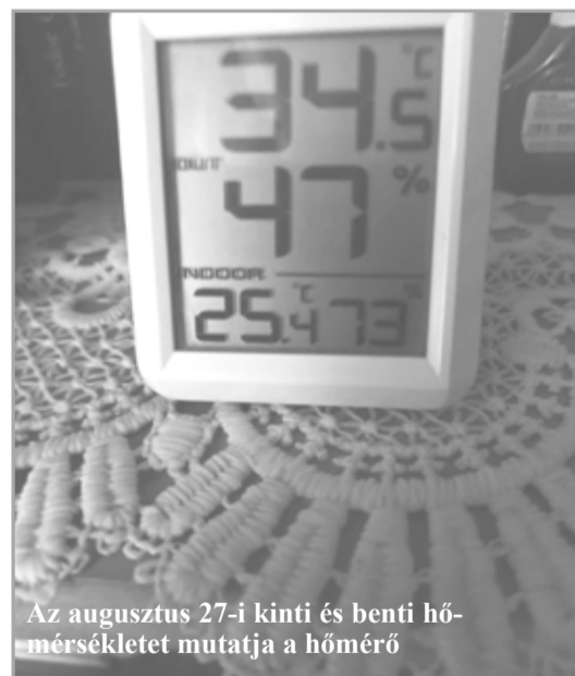
Az augusztus 27-i kinti és benti hő- mérsékletet mutatja a hőmérő

porra, melynek nyomán enyhült a forróság. A kibírhatalannak tűnő 40-44 fokos meleggel így nem kellett szembe- szállniuk.