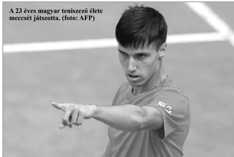
A 23 éves magyar teniszező élete meccsét játszotta.

detét vette a 2023-as idény. Az első fordulóban Királyháza idegenben alaposan kitömte (12-0) a Beregszászi FC-t, míg a másik Vérke-parti együttes, a Beregszászi Jobbpart FC az Onoki Csil-