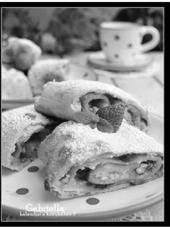
Gabriella kalandjai a konyhában