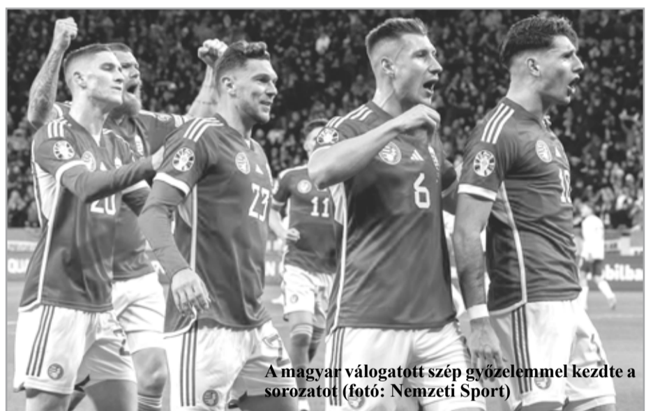
A magyar válogatott szép győzelemmel kezdte a sorozatot

A sorozatot ugyancsak szabadnaposként kezdő ukránok az új kapitány, Ruszlan Rotany irányításával az első találkozót vasárnap 2-0-ra elvesztették Anglia vendégeként. Kane és Saka már az első félidőben kialakították a végered-