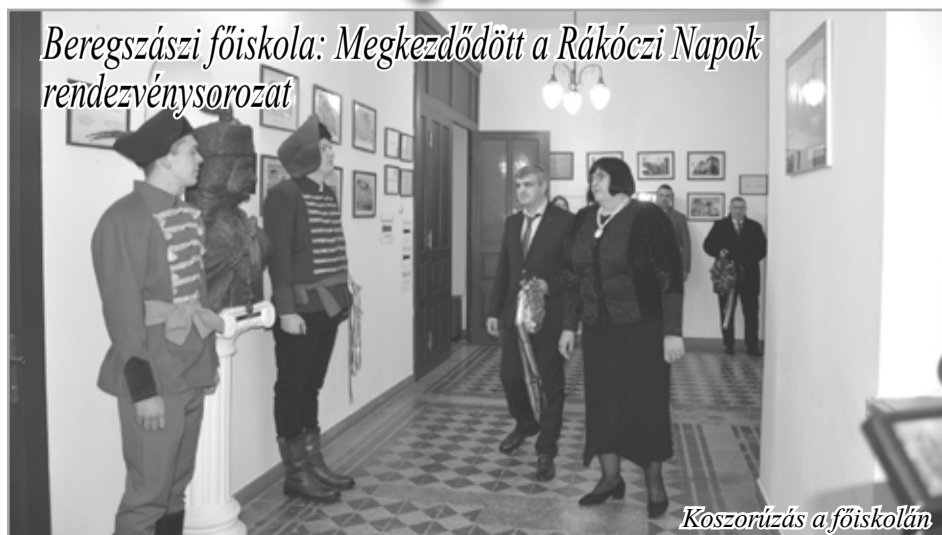
Koszorúzás a főiskolán

Beregszászi főiskola: Megkezdődött a Rákóczi Napok rendezvénysorozata