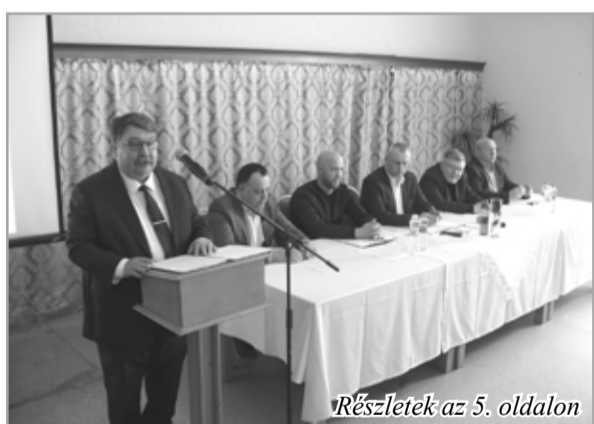
Részletek az 5. oldalon