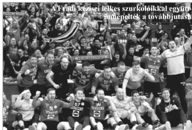
A Fradi kézilabásjai lelkes szurkolóikkal együtt ünnepelték a továbbjutást.

Az ukrán együttes Romániában 29-24-re, illetve 29-23-ra kapott ki, míg a magyar válogatott előbb Németországtól 26-20-ra, majd Lengyelországtól 31-29-re maradt alul.