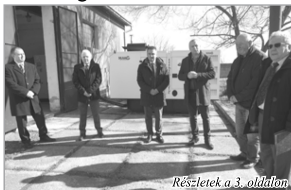
Részletek a 3. oldalon