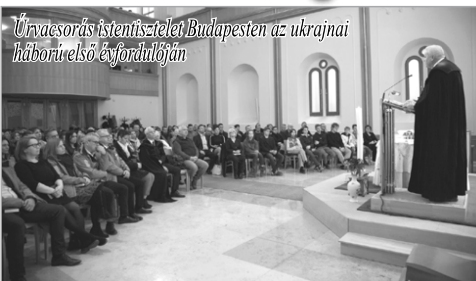
Úrvacsorás istentisztelet Budapesten az ukrán háború első évfordulóján