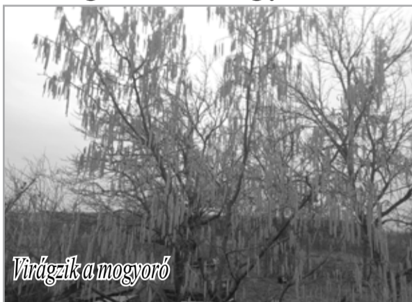
Virágzik a mogoró