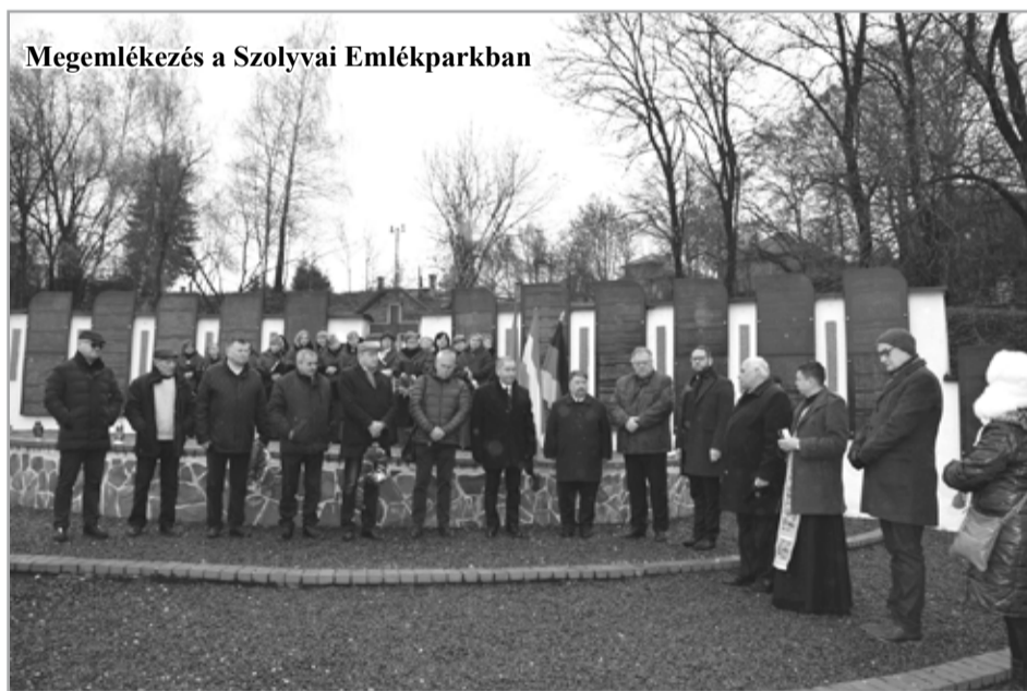
Megemlékezés a Szolvyvai Emlékparkban