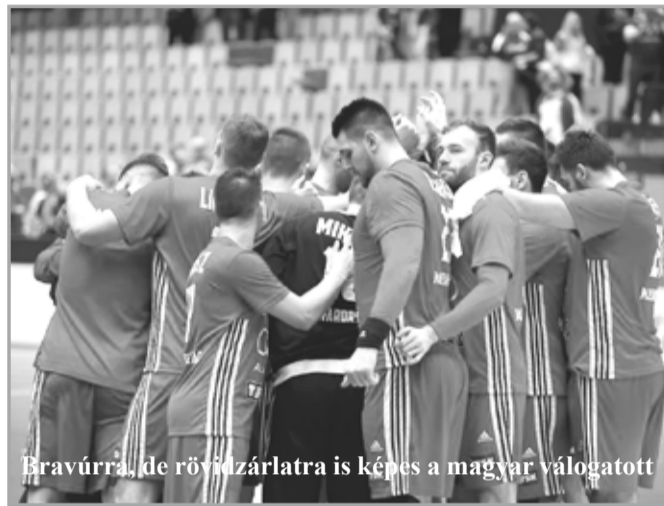
Bravúrral, de rövidzárlatra is képes a magyar válogatott

Sikeres hétvégét zárták a magyar női kézilabda-kupacsapatok, hiszen a pályára lépő hat együttes közül csak a Vác és a Mosonmagyaróvár szenvedett vereséget.