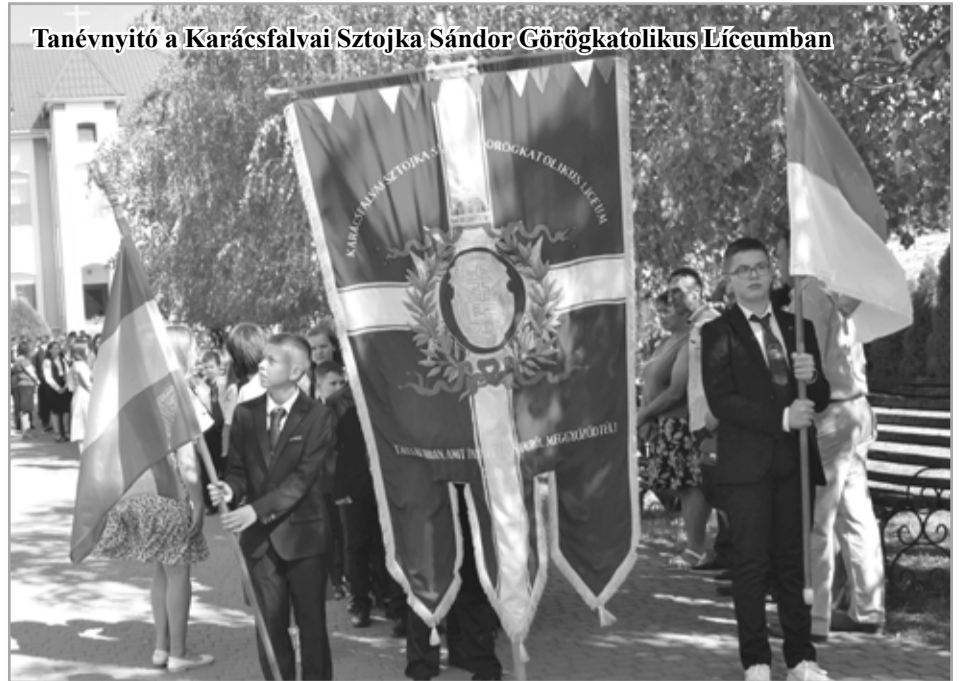
Tanévnyitó a Karácsvfalvai Sztójka Sándor Görögkatolikus Líceumban

Az elmúlt év elején még azt reméltük, hogy a pandémia okozta megszorítások, a bezártság, és nem utolsósorban a szeretteink elvesztése miatti fájdalom után végre egy új, nyugodtabb időszak következik. Nem ez történt. Mert a 2022. február 24-én kitört háború mindent megváltoztatott. Kényszerűségből igen sok nemzettársunk hagyta el a szülőföldjét. S félő, hogy közülük egyesek már nem térnek vissza. Nap mint nap fájdalommal érezzük át a hiányukat. Ám az itthon maradtak, a minden nehézség ellenére is kitartók a nehezített körülmények között is jelzik, hogy nemzetrészüink tagjai számára van élet a Kárpátok alatt. És ha a csillagok állása kedvezőre fordul, a háború által elsodortakat haza várjuk. Hogy együtt építsük a közös, békésebb, biztonságosabb jövőt. Ezzel a reménnyel elevenítjük fel a 2022-es esztendő emlékezetes pillanatait.