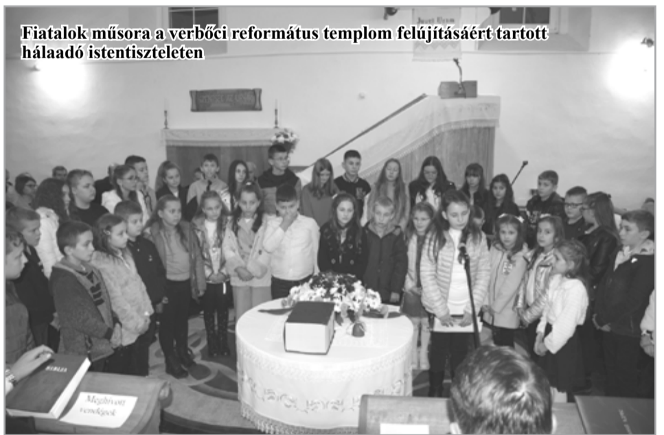
Fiatallélek műsora a verbőci református templom felújításáért tartott hálaadó istentiszteleten