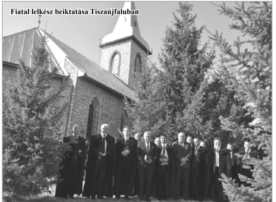
Fiatallélek beiktatása Tiszaújfaluban