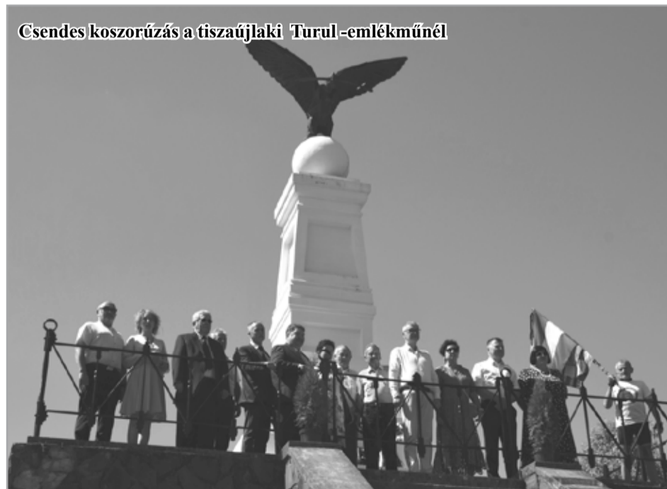
Csendes koszorúzás a tiszaujlaki Turul- emlékműnél