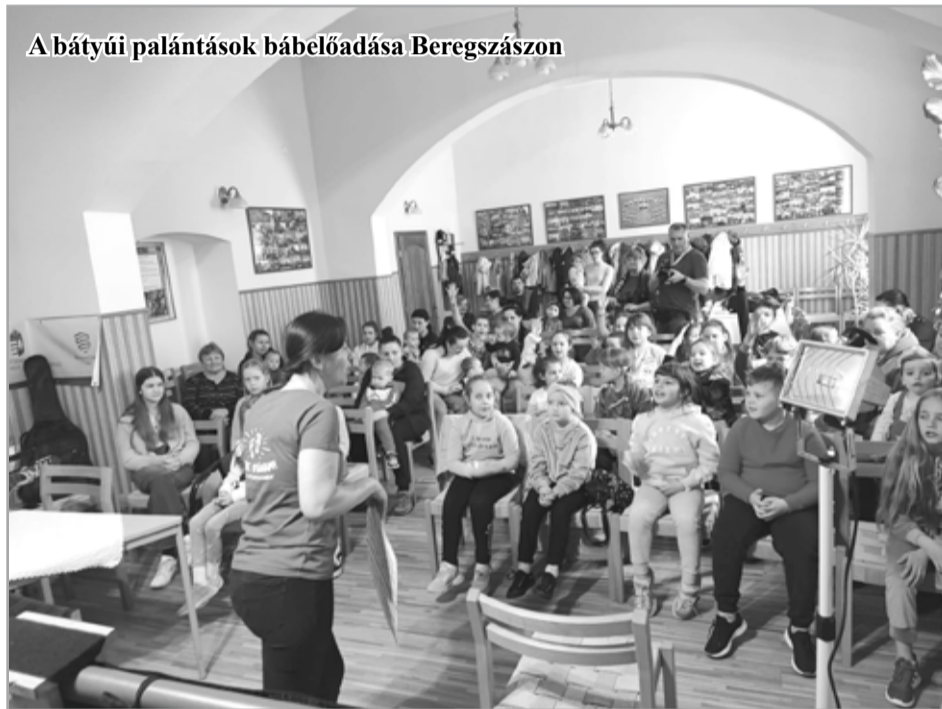
A bátyúi palántások bábéledása Beregszászban