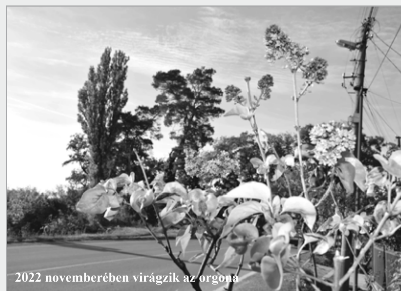
2022 novemberében virágzik az orgona