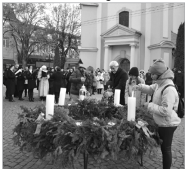
Részletek az 5. oldalon