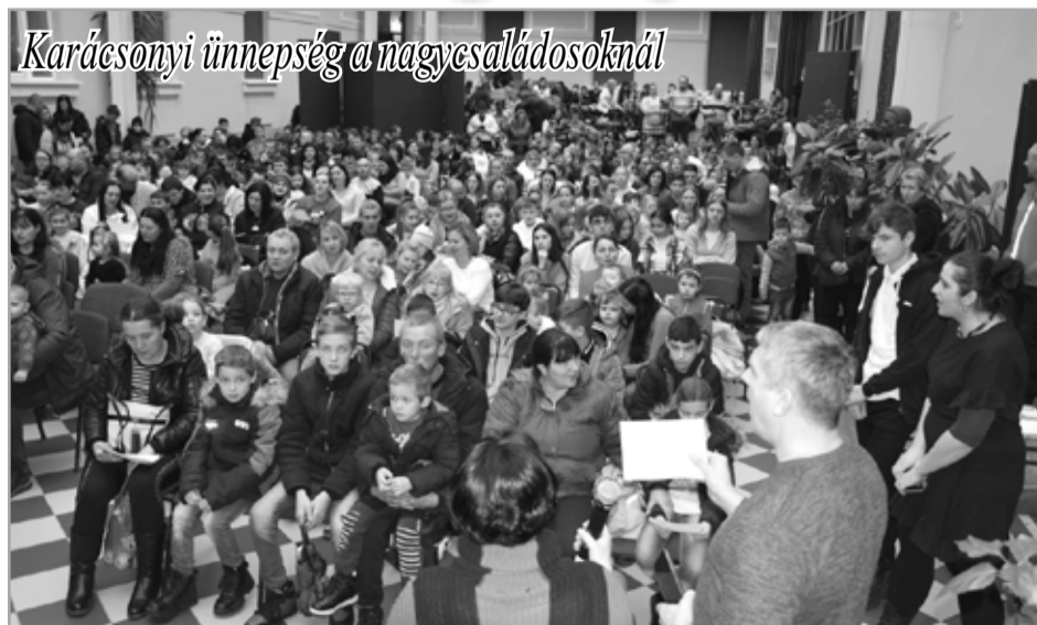
Karácsonyi ünnepség a nagycsaládosoknál

A közel ezer tag- Acsaládot tömörít- ő Kárpátaljai Ma- gyar Nagycsaládosok Egyesülete idén ünne- pi megalakulásának ti- zedik évfordulóját. A kárpátaljai nagycsalá- dosok többsége a hábo- rús helyzet ellenére az itthon maradás mellett döntött. Illetve amel- lett, hogy a nehéz kö- rülmények közepette is megtartják a hagyó- mányos karácsonyi ün- nepüket, amelyre a II. Rákóczi Ferenc Kár- pátaljai Magyar Főis- kolán került sor. Itt ki- osztották azt a sokszáz csomagot, amelyet a Katolikus Karitás, il- letve a magyarországi testvérszervezetek ju- tattak el a nehéz idők- et élő kárpátaljaiaknak.