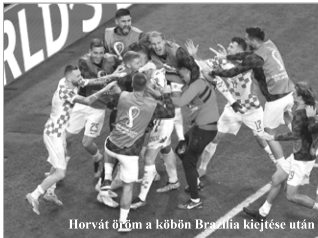
Horvát öröm a kőben Brazília kiejtése után

A nyolcadöntőben Svájcot 6-1-es kiütéssel megalázó Portugália képtelen volt fogást találni az utolsó versenyben lévő afrikai résztvevő Marokkón. A sokak által antifutballt, az érintettek szerint hősies produkciót bemutató Marokkó az első félidőben szerzett góllal kibekelte a mérkőzést a második félidőben már Cristiano Ronaldót is bevető Portugáliával szemben, így sporttörténelmet írt! A világbajnokságok során