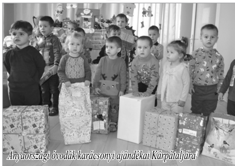
Anyaiországi óvodák karácsonyi ajándékai Kárpátaljára

N évre szóló aján- dékcsomagok ér- keztek december 7-én Badalóba a helyi két óvoda gyermekei szá- mára, amelyeket előze- tesen Veszprém megyei óvodák összefogásának köszönhetően a Magyar Református Szeretet- szolgálat munkatársai juttattak el a Tisza-par- ti településre.