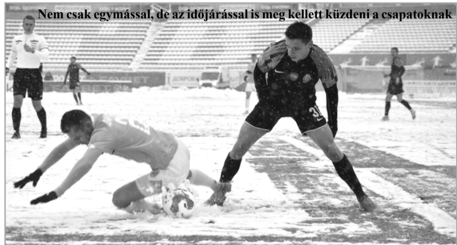
Nem csak egymással, de az időjárással is meg kellett küzdeni a csapatoknak

A Zorja és a Dinamo botlása nem jött rosszul az ugyancsak az érmekért hajtó Sahtar Donyecknek, amely izgalmas vég-hajrá után nyert a Vorszkla ellen Lvivben. A Sahtar már 2-0-ra is vezetett, de a poltavaiak egyenlítőni tudtak. Végül a 86.