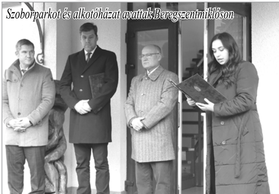
Szoborparkot és alkotóházat avattak Beregszentmiklóson

A szobrok a kultúra A hitvallásai voltak egykor, s azok ma is. A most átadásra kerü- lő Beregszentmiklósi Szoborpark és Alkotó- ház ilyen szempontból kettős szerepet tölt be: gyűjti a magyar- ság életjelét hordo- zó szobrokat, továb- bá teret kínál annak, hogy a sokféle stílusú alkotásban utat talál- jon magának a kor- társ kultúra művészi igényű ága, hangzott el a mintegy 2,5 hek- táron elterülő kul- turális létesítmény megnyitó ünnepségén. Ahol a közeljövőben nem csupán az éven- te megrendezésre ke- rülő szobortáborok- ban készült alkotáso- kat tekinthetik meg az érdeklődők.