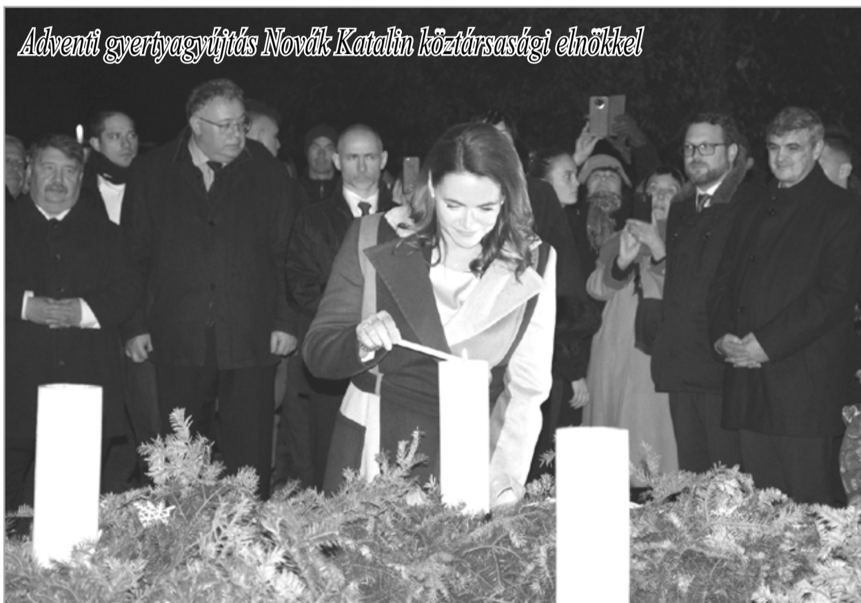
Adventi gyertyagyújtás Novák Katalin köztársasági elnökkel

I mmáron hagyó- mány, hogy kará- csony közeledtével Beregszász lakói közös adventi gyertyagyúj- táson vesznek részt. Rendszerint sokan el- jönnek, hogy együtt le-