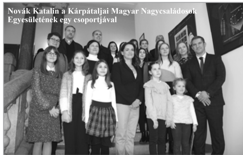
Novák Katalin a Kárpátaljai Magyar Nagycsaládosok Egyesületének egy csoportjával