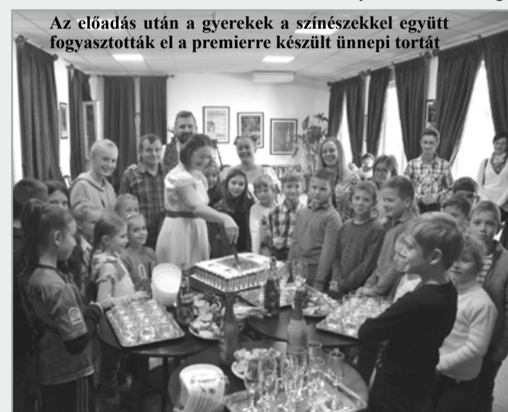
Az előadás után a gyerekek a színészekkel együtt fogyasztották el a premierre készült ünnepi tortát

Úgy gondoljuk, ebben a nehéz időben a szívükhöz, a lelkükhöz kell szólni. Ezúttal Ursula Jones A királykisasszony, akinek nem volt birodalma című művére esett a választás, amit Gyevi-Bíró Eszter rendező vezetésével a tárgyszínház eszközeivel dolgoztak fel színészeink. Itt a tárgyak jelként funkcionálnak – mondta a beregszászi színház igazgatója. – Egy példaértékű összefogás eredményeként jött létre ez az előadás, hisz budapesti a rendező, külföldi a szerző, és az Örkény István Szerzői Jog-