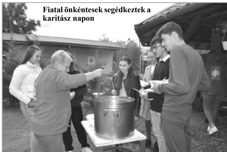
Fiatalkéntesek segítettek a karitásznapon

telességünk lenne. Ehhez az Úrtól jeleket kapunk, mondta. Legtöbbször bennünket küldjésként embertársaink számára, hogy az ő szeretetét, vigasztalását, segítségét adjuk át. A cselekvő szeretethez kapcsolódóan többször is idézte Jézus