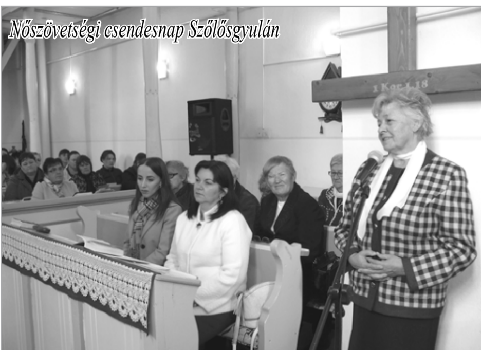
Nőszövetségi csendesnap Szőlősgyulán

B etegségek, járvá- nyok, gazdasági vál- ság, háború... Oly kor- ban élünk, ami igencsak próbára tesz. És legin- kább panaszra nyílik a szánk. Ilyen körülmé- nyek között miért is ad- hatunk hálát? – teszik fel sokan a kérdést. Erre keresték a választ a Szőlő- sgyulán megtartott nő- szövetségi csendesnap résztevői is. És már az első percekben is meg- győződéssel vallották, igen, van miért hálát ad- nunk, csak meg kell lát- nunk a mindennapok apró csodáit.