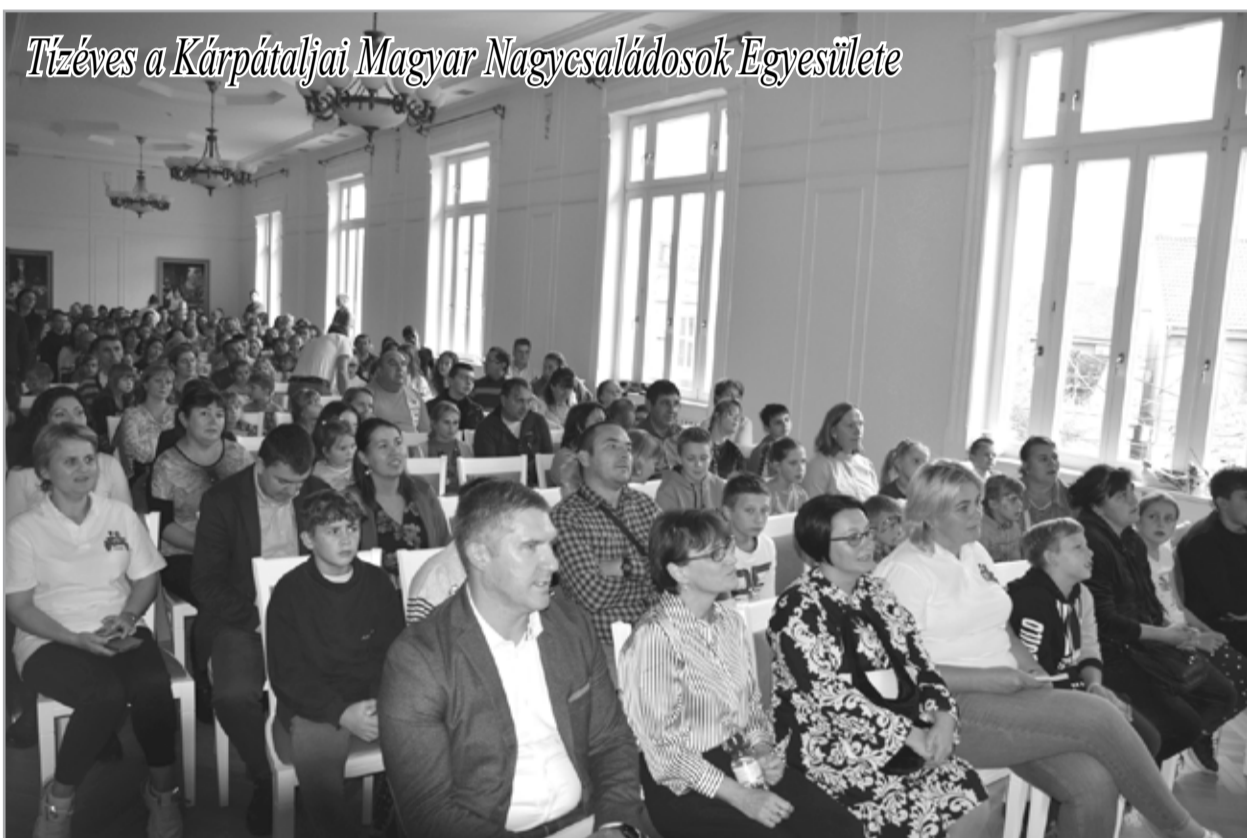
Tízéves a Kárpátaljai Magyar Nagycsaládosok Egyesülete

A Kárpátaljai Ma- gyar Nagycsalá- dosok Egyesüle- te (KMNE) tízéves mű- ködésével kapcsolatban sok szépet és jót lehet- ne elmondani, ám a leg- fontosabb mégiscsak az, hogy a mostani ember-