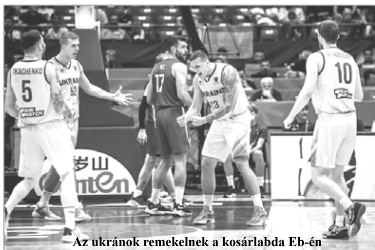
Az ukránok remekelnek a kosárlabda Eb-én

Első három csoportmeccsét elvesztette, így már biztosan nem jut tovább csoportjából a magyar válogatott a férfi kosárlabda Eb-én