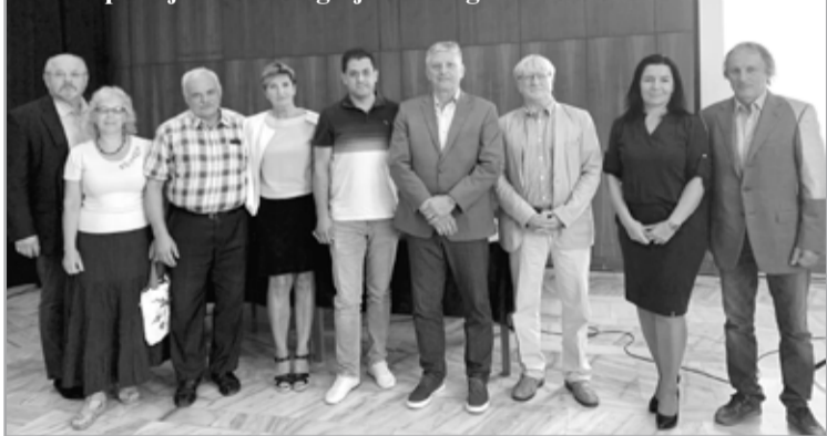
A Kárpátaljai Szövetség új elnöksége

minckeddik találkozóra került sor. A szövetség idén is ingyenes buszt biztosított a Kárpátaljáról érkező vendégek számára. Ez arra jó alkalomnak bizonyult, hogy az emberek néhány napra maguk mögött tudhassák a háborúval terhelt mindennapokat. A vendégek péntek déltől foglalták el a szállásukat, miután regisztráltak.