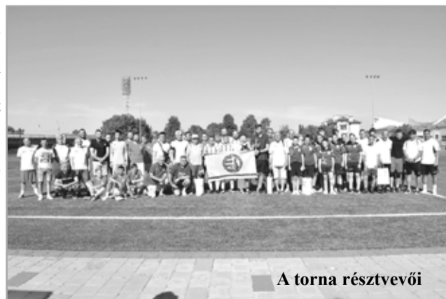
A torna résztvevői

rás csapata 5-3-ra nyert a Lobda hírportál szerkesztősége ellen. A KISZO és a TV21 közös gárdája a nyolcadik helyen zárta szereplését.