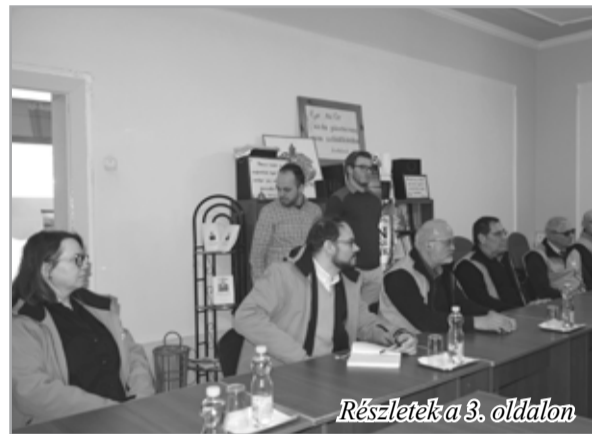
Részletek a 3. oldalon