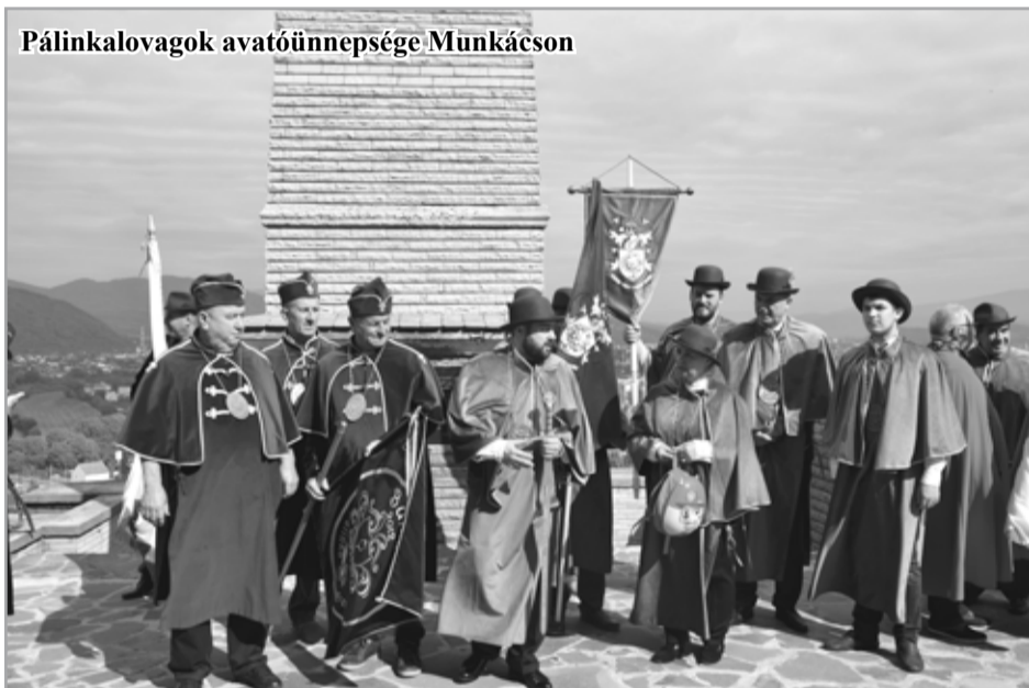
Pálinalovagok avatóünnepsége Munkácson