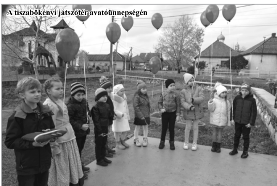
A tiszabökényi játszótér avatóünnepségén