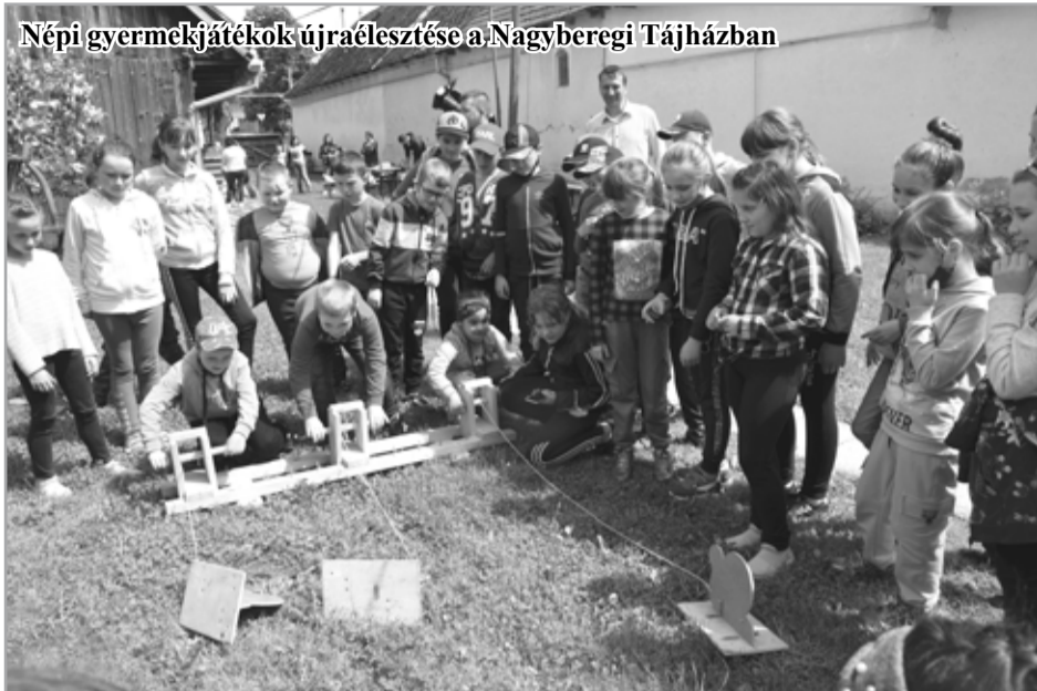
Népi gyermekjátékok újraélesztése a Nagyberegi Tájháznál