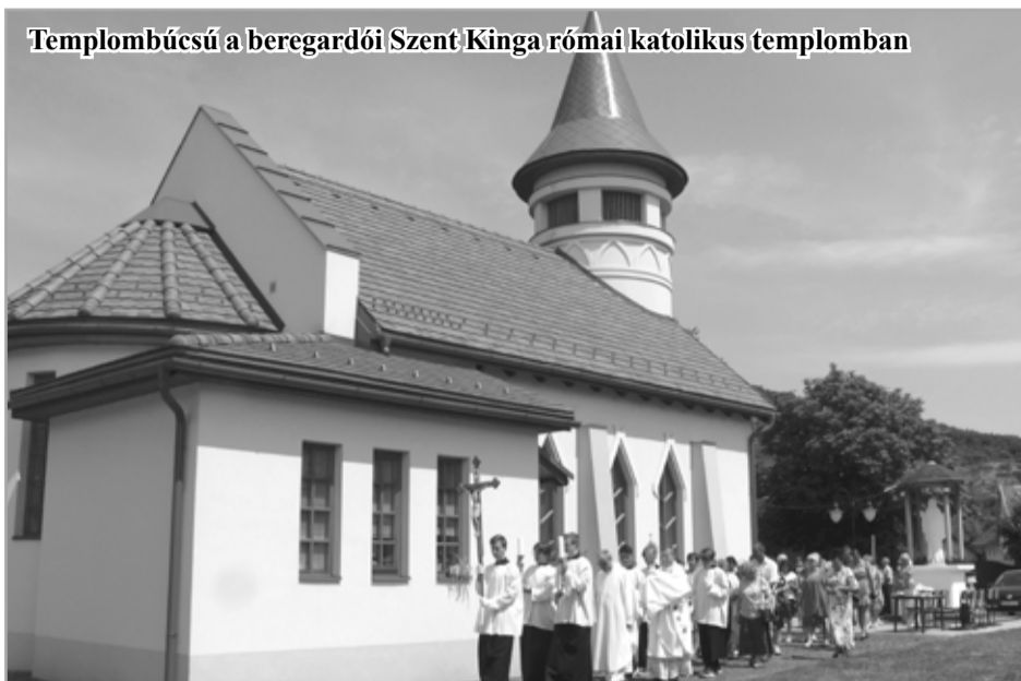
Templombúcsú a beregardói Szent Kinga római katolikus templomban