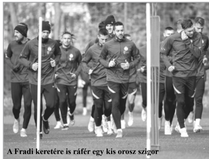
A Fradi keretere is ráfér egy kis orosz szigor