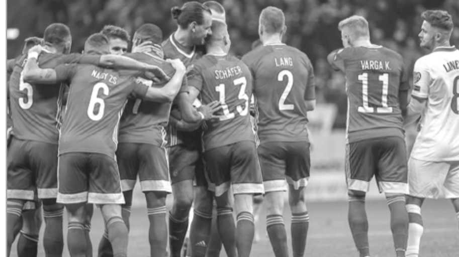
A magyarok bravúros győzelemmel zárták a vb-selejtezősorozatot

pótselejtezős Lengyelország vendégeként.